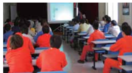
服务工程师在用户现场进行安装使用培训