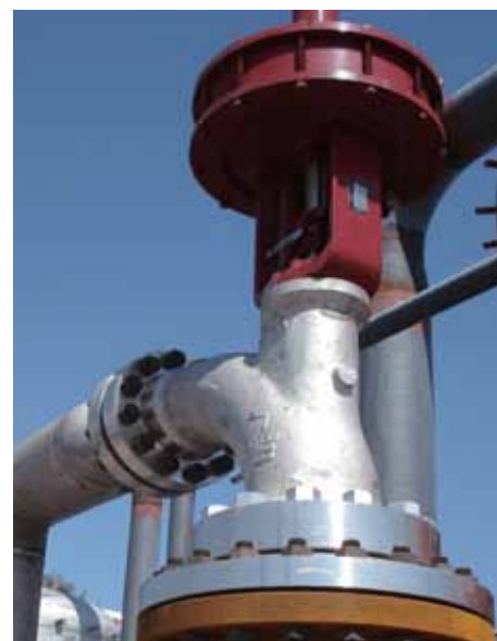
某煤化工现场安装的梅索尼兰73000系列 长弯径黑水灰水阀门

言民营企业的迅速发展带来了更为激烈的市场竞争，但公司在品质和服务等几个重要环节上仍然保持着自己的核心竞争力。她说：“对工业用户来说，关键部位的阀门经久耐用和可靠性，这是首先要关心的问题。从90年代起调节阀开始在国内大规模发展应用，到目前已经有十几年的历程，我们产品的可靠性和耐用性深得用户信赖。我们曾在广石化加氢装置上的一个高压角阀，用户告诉我们这个阀用了17年从来没有发生任何问题，现在仍然正常运转。我们在天津乙烯同用户交流时，发现有几只梅索尼兰的凸轮挠曲阀已经持续工作了很多年，竟被戏称梅索尼兰阀门在现场是被人遗忘的角落。用户当然希望关键部位的阀门能够达到可靠性高，经久耐用的标准，如果出现维修或者事故的情况必然会给他们带来很多麻烦。当然，作为销