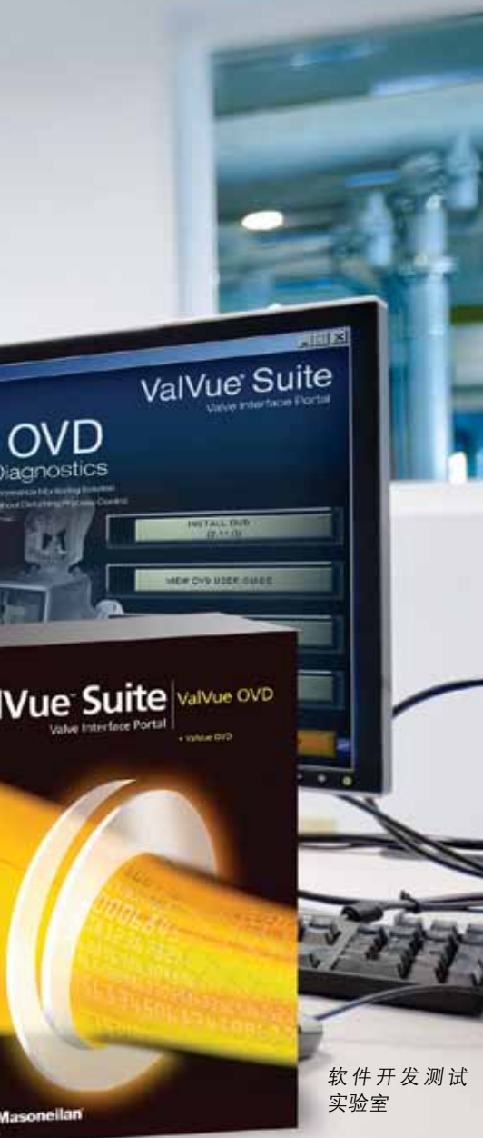
软件开发测试 实验室

80年代开始使用梅索尼兰等调节阀品牌，因此很多国内早期的从事仪表和调节阀的技术人员都非常认同这个品牌。康索里德品牌的安全阀，同梅索尼兰一样有着悠久的历史，多年来一直致力于向电厂提供高压高温蒸汽、锅炉配套等要求级别较高的安全阀，大量的成功应用使该品牌在国内外用户中享有较高的声誉。”