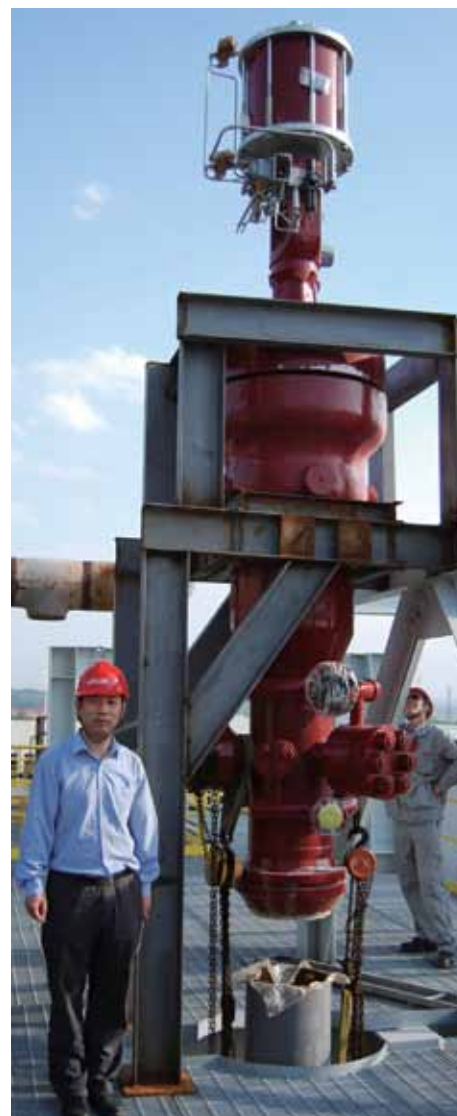
梅索尼兰84000系列STEAMFORM 蒸汽减温减压器结合了多年的应用经验和最新的喷水降温专利技术，将压力调节和温度调节合二为一，结构紧凑，设计合理，调节效率高，性能卓越，广泛适用于电力、石油、石化、钢铁、炼油、造纸、食品、化肥、城市热力等工业中。图为减温减压器在某装置现场。