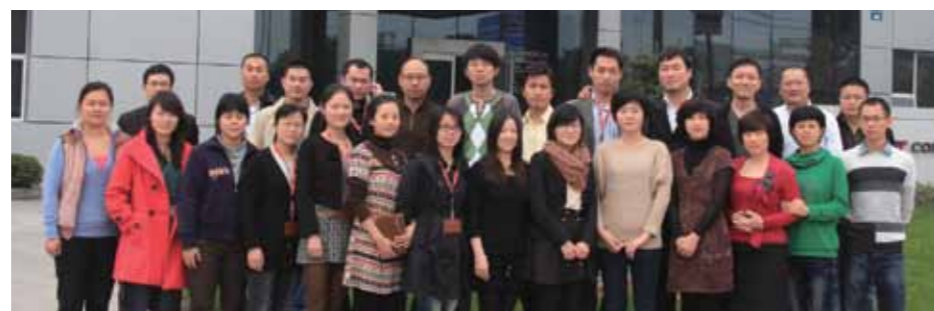
2011年10月博雷中国销售培训班合影

Davenport先生告诉我们，其实博雷的其它许多产品也非常受欢迎，公司已经实现了产品线的多元化。他还说：“我们的蝶阀可以分成好几个家族，分别用于各种不同的领域。这是我们的主要产品之一，也是努力经营的成果，尤其是在中国市场。同时，博雷还拥有规格齐全的球阀系列产品，使我们在化学、石油化工以及一些电力领域中拥有不错的市场份额。我们目前还有一个保持继续发展的机遇，就是在中国市场开拓止回阀业务。前几年我们刚刚开始了这个项目，目前正尝试在中国客户中进一步拓展知名度。除了手动阀门外，博雷在开/关自动阀门和调节控制阀领域也有很深的造诣，主要的相关产品就是博雷的电动和气动执行器系列。”