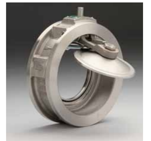
对夹旋启式止回阀 ASME Class 125-2500 1" -60" (25mm-1200mm) 重量轻、安装简便、低成本、减少水锤、节省泵推送成本