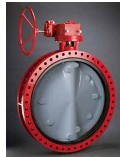
衬胶阀座蝶阀 尺寸达到120" (3米) 压力等级至 150psi