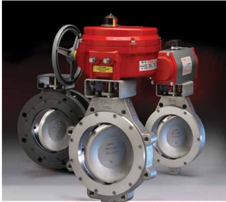
Bray/McCannalok 高性能蝶阀 双偏心设计，确保在全额定压力下双向气密封关闭。 • 对夹式，支耳式和双法兰式 • ASME Class 150, 300&600 • 2 1/2" -60" (65-1500mm)

为了支持公司对全球市场的产品供应，博雷对它位于杭州的这座现代化化工厂投入了巨资。“目前这里共有600多位员工，”Davenport先生继续说道：“而工厂也融入了最先进的管理理念，并在厂房内配备了包含行业尖端技术的各类设备。”