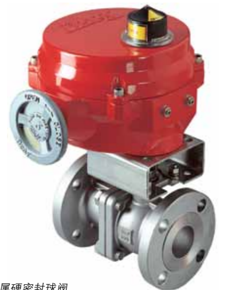
金属硬密封球阀 ANSI Class 150, 300 (PN10-40) 1/2" -8" (12.5-200mm)

“博雷是一家表现优异的企业，”他总结道：“25年前公司成立之初，当时只有两位成员，客户也只有一家。25年后的今天，博雷国际已经拥有了1500位员工和数千家客户，这绝不是偶然的。在我们的客户名单中，世界各地的许多大牌企业都赫然在目，他们对于博雷公司的表现都深有感触，这也是他们不断地和博雷继续业务的原因。我们需要的不是一次性的订单业务；我们寻找的是长期的业务合作以及战略伙伴。” ■