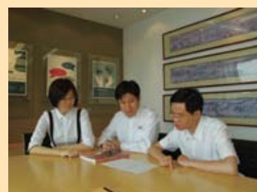
克瑞员工向您推荐技术文献 TP-410

请登陆以下网站了解更多信息： www.craneflowsolutions.com www.craneco.com